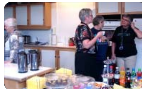
– en ellers travl Café set i en pause...

Sidste spejdermøde inden sommerferien bliver tirsdag d. 22. juni.