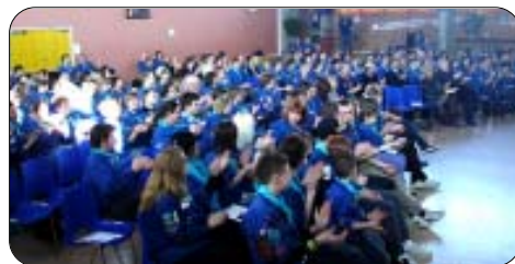
Kredsen synger ved åbningen