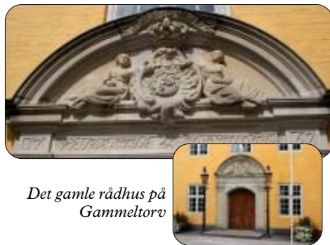
Det gamle rådhus på Gammelortorv

Husk tilmelding til stævnet i Mariager fra 18-24. juli. Se nærmere på Baptistkirkens hjemmeside