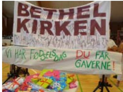
-ingen kunne tage fejl af at vi var i gavehumør