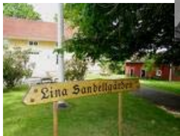
Lina Sandell og hjemmet i Fröderyd i Sverige

Lina Sandell forfattede ca. 2000 salmer og sange og om hende blev der sagt: „Hun har fået gaven at formidle fred, trøst og glæde“. Kom og hør om hendes opvækst hos forældrene, om ægteskabet med Købmand Berg, om sangteksterne og vær med til at synge hendes smukke og livsbekræftende salmer.