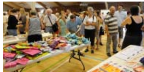
Køen var lang for at skrive i gæstebogen og få en af de mange flotte gaver.