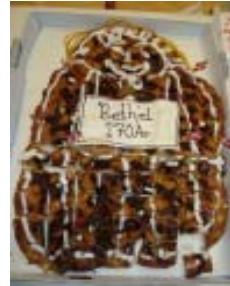
Kagemand, som der var 4 af, gik som varmt brød til de mange gæster i menighedens stand.