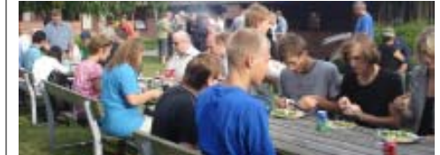
- og så blev der virkelig grillet i et dejligt spisefællesskab

Cirka 120 Bethel-folk havde taget imod indbydelsen til årets menighedsweekend på Rebild Efterskole 6.-8. august. Fredag bød på mad fra grill, høvdingebold, refleksionsvandring og almindelig hygge.