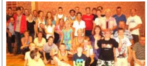
Her et lille udsnit af de mange glade weekend-deltagere, der deltog i mesterskaberne i „høvdingebold“.