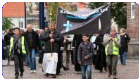
På vej fra Katolsk Kirke til Budolfi Kirke