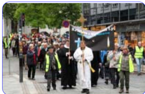
På vej fra Budolfi Kirke til Bethelkirken